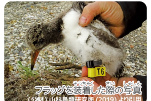
フラッグを装着した際の写真