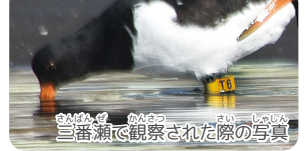
三番瀬で観察された際の写真