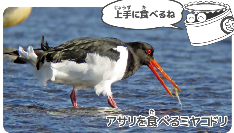
アサリを食べるミヤコドリ

ミヤコドリは何を食べているの? ミヤコドリの英名は「Oystercatcher (オイスターキャッチャー)」といって、カキ (オイスター) などの二枚貝を食べる習性に由来しています。二枚貝以外にもゴカイやカニなどを食べるようですが、三番瀬では主にシオフキやアサリ、マテガイなどを食べている姿がよく見られます。